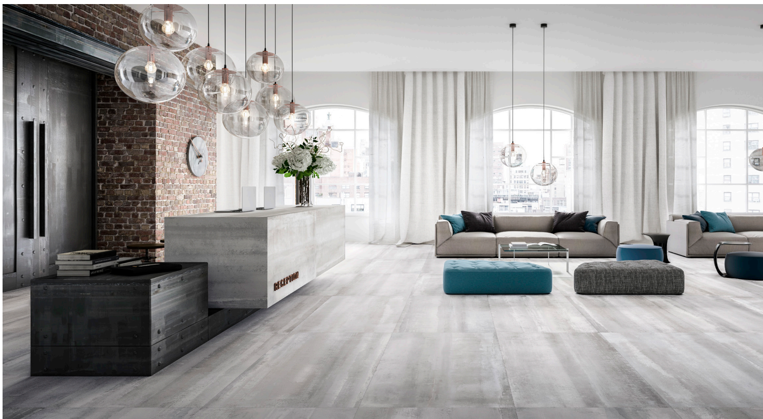
DOLPHIN (Gris Pâle)