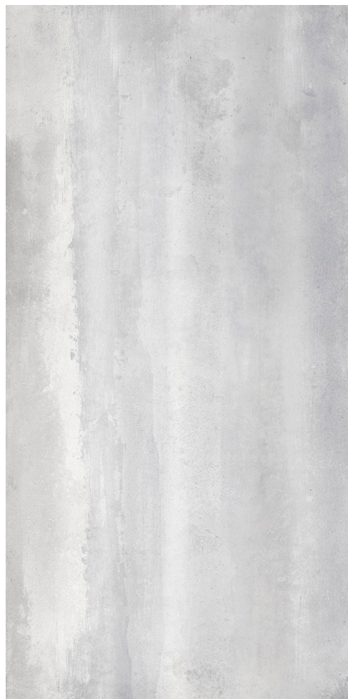
DOLPHIN (Gris Pâle)

30 x 60 cm (12 x 24) Mat RF.OV.DLN.1224.MT